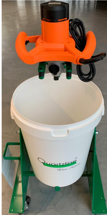
Quartzline Mobile Mixer

Mengen word het beste gedaan in de Quartzline Mobile Mixer. Met de Quartzline Mobile Mixer kunt u 50 tot 75 kilo tegelijkertijd mengen.